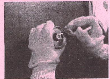
まず上フタを切り取り