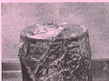
アルミホイルで密封