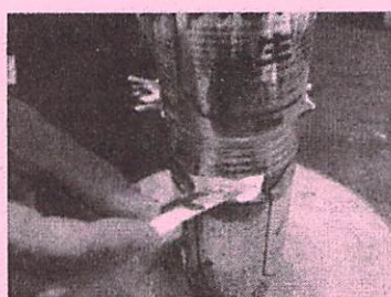
下のかまどもアルミ缶