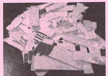
牛乳パック2個を燃料に